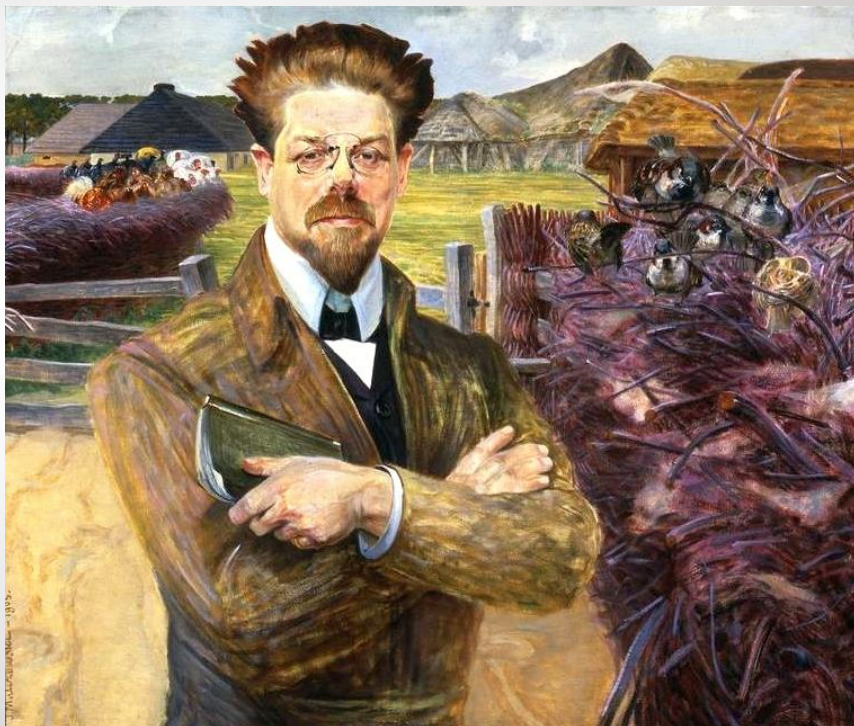
Jacek Malczewski, Portret Władysława Reymonta, 1905

Od 24 listopada 1961 ulica w Warszawie, na terenie obecnej dzielnicy Bielany, nosi nazwę alei Władysława Reymont. W 1967 na fasadzie domu przy ul. Górnośląskiej 16, w którym zmarł, odslonięto tablicę pamiątkową.